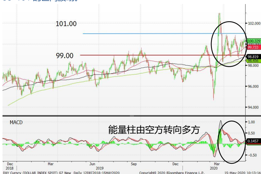
图1：美元指数-日线图：美元指数回升至100的上方。能量柱由空方转向多方，这暗示美元指数料继续受到支持。短期内，美元指数料在99-101的区间波动。