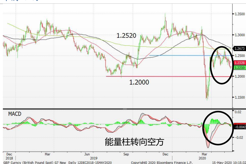
图 3: 英镑/美元-日线图: 英镑维持震荡下行的走势。能量柱转向空方，暗示英镑的下行压力犹存。短期内，若英镑兑美元跌破 1.22，或进一步下试 1.20。