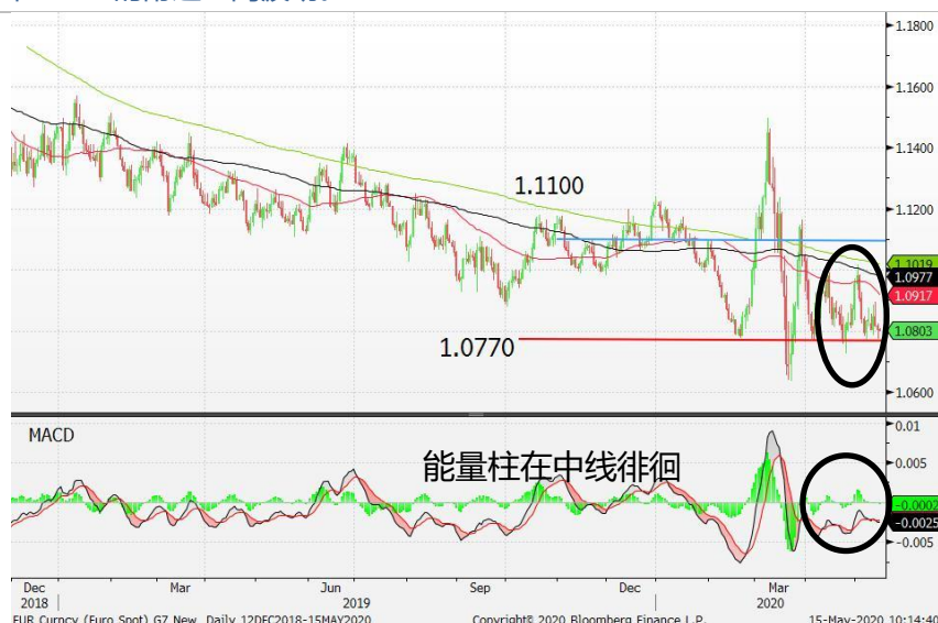
图 2: 欧元/美元-日线图: 欧元兑美元在 1.08 附近盘整。能量柱在中线徘徊，这暗示欧元或维持好淡争持的走势。短期内，欧元兑美元料继续在 1.08 的附近区间波动。