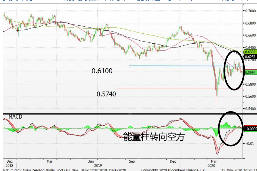
图 7：纽元/美元-日线图：纽元兑美元分别失守 50 天(红)移动平均线及 0.60 的支持位。能量柱转向空方，纽元料继续受压。短期内，除非纽元/美元跌穿 0.5950 的支持位，否则未必能够进一步下试 0.5740 的水平。