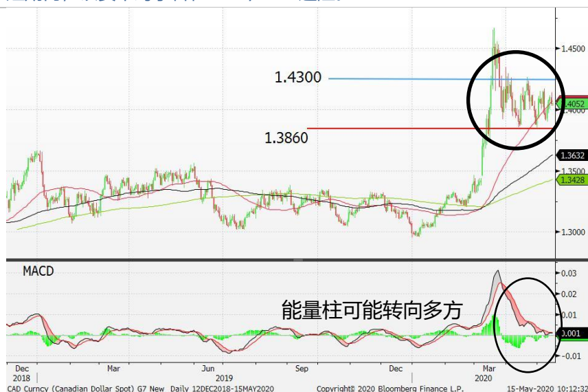
图 5：美元/加元 - 日线图：美元兑加元继续在 50 天(红)移动平均线找到较强的支撑。能量柱可能转向多方，从而继续为美元兑加元提供支持。短期内，该货币对子料在 1.42/1.43 遇阻。